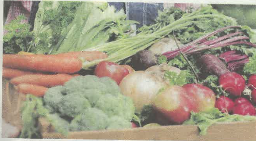
Festa está marcada para os dias 21 e 22 de julho