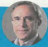
Vitor Manuel de Almeida Figueiredo, Presidente da Câmara Municipal de S. Pedro do Sul.

Comemoração do 16.º aniversário de um jornal regional é um momento importante nos tempos do mundo digital, ainda mais quando falamos de um semanário de referência como é o Jornal do Centro.